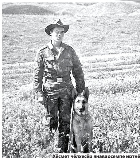
Хёсмет чөлхөсөр янавәрсемпе иртнө

Пөррөмөшө – аслисем каланине итлемелле. «Вёсем усал пултәр тесе каламассө, сирёншөн тәрәшәссө. Аслисем кала-