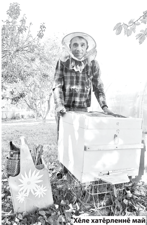
Хёле хатёрленнә май