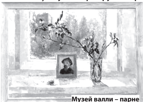
Музей валли – парне