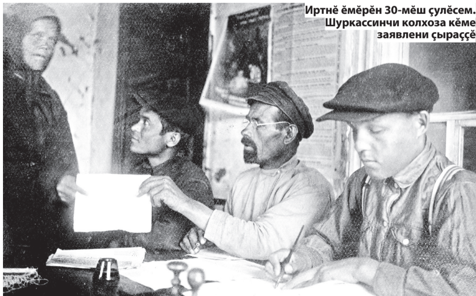
Иртнё ёмёрён 30-мёш сүлёсем. Шуркассинчи колхоза кёме заявлени сыраççё

Страницяра "Достижения Чувашии. 1927-1931" фотоальбомри сән үкерчёксене усă курнă