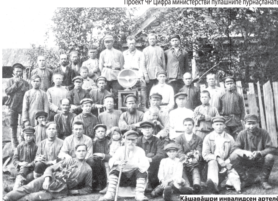
Кашавшри инвалидсен артелё