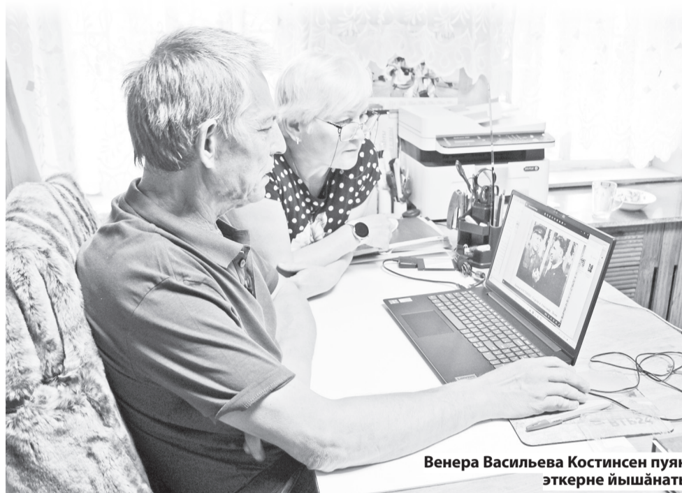
Венера Васильева Костинсен пуян эткерне йышанат

Проект ЧР Цифра министерства пулшнине пурнашланат